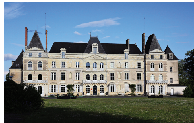
Château de Briançon