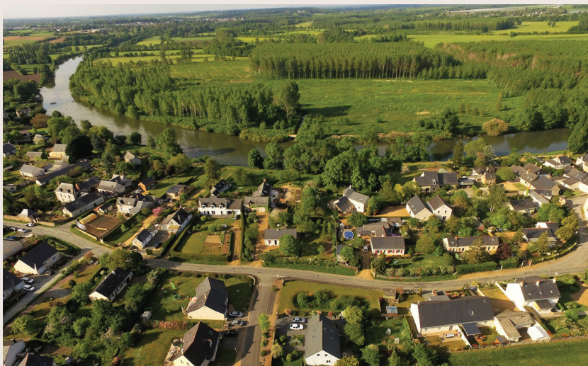
Bords de Sarthe (Juvardail)